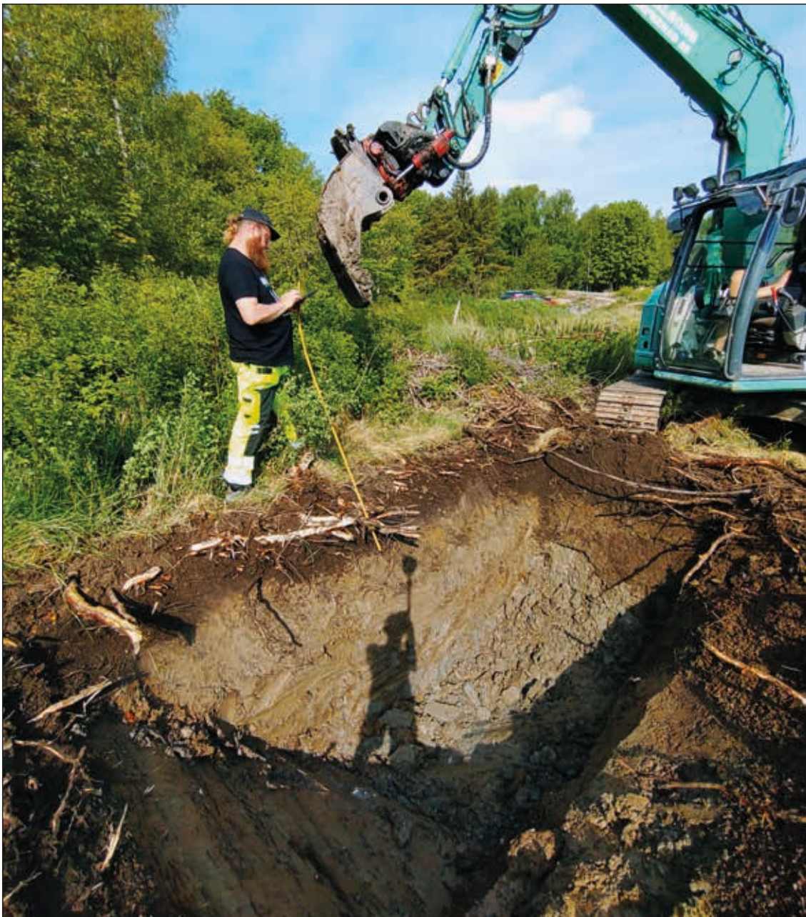
Figur 8. Schaktet S1 grävdes som ett djupschakt. Foto mot norr.

S11, som grävdes i norra delen av fastigheten, var det enda schaktet på ytan som verkade ha, av sentida händelser, ostörda lager. Under grässvålen fanns lager med brun sandig matjord som övergick till brun stenig sandjord. I matjorden hittades en bit övrigt slagen flinta.