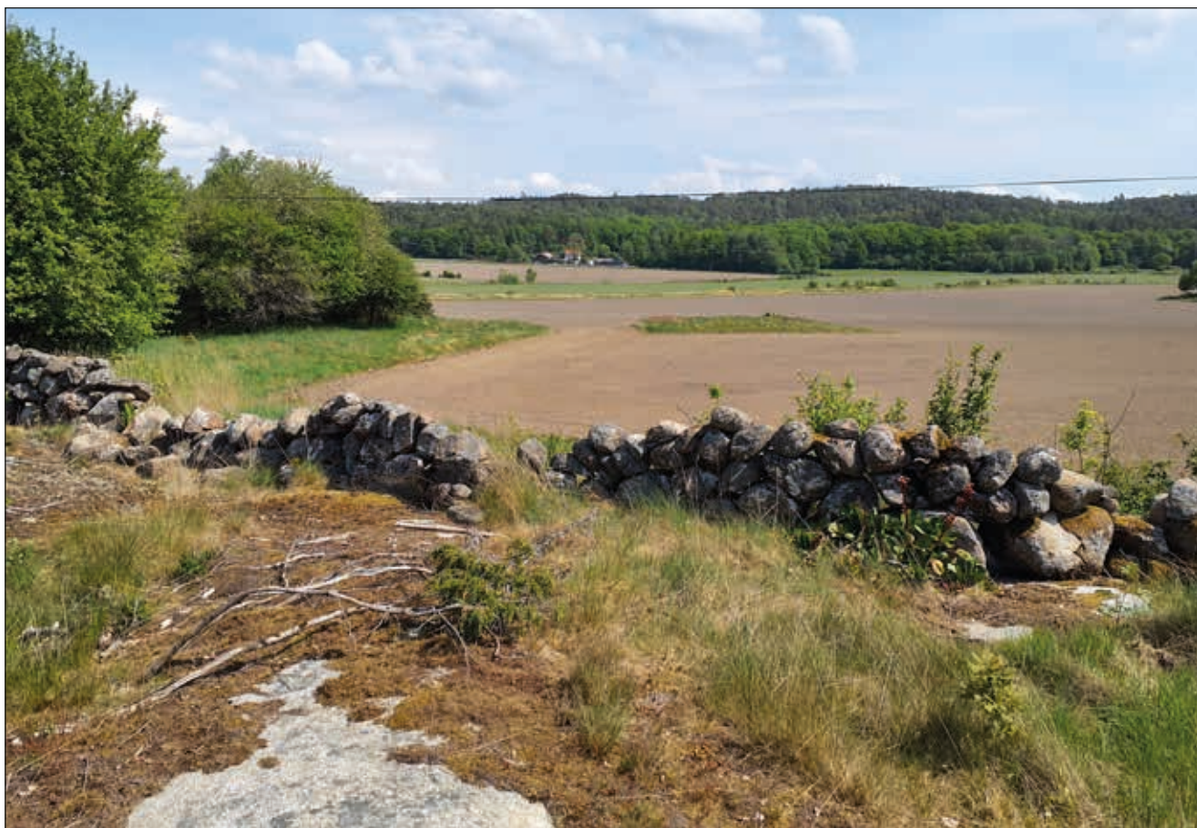
Figur 3. Utsikt från berget vid Sörslättshögen 2:4. På den öppna åkerytan närmast i bild finns L1968:7434. Stengårdsgården utgör fastighetsgränsen. Foto mot nordost.

Fornlämningen L1968:7434 (RAÄ Säve 299:1) utgör en boplats, cirka 80x70 (N–S), med en yta om cirka 4 200 m 2 storlek. Platsen för lämningen utgörs i dag av åkermark som brukas (figur 3). Från kulturmiljöregistrets utdrag från 1989 finns anteckningar att det inom boplatsen har påträffats flintor i form av avslag, kärnor och knackstenar (Fornsök 2023).