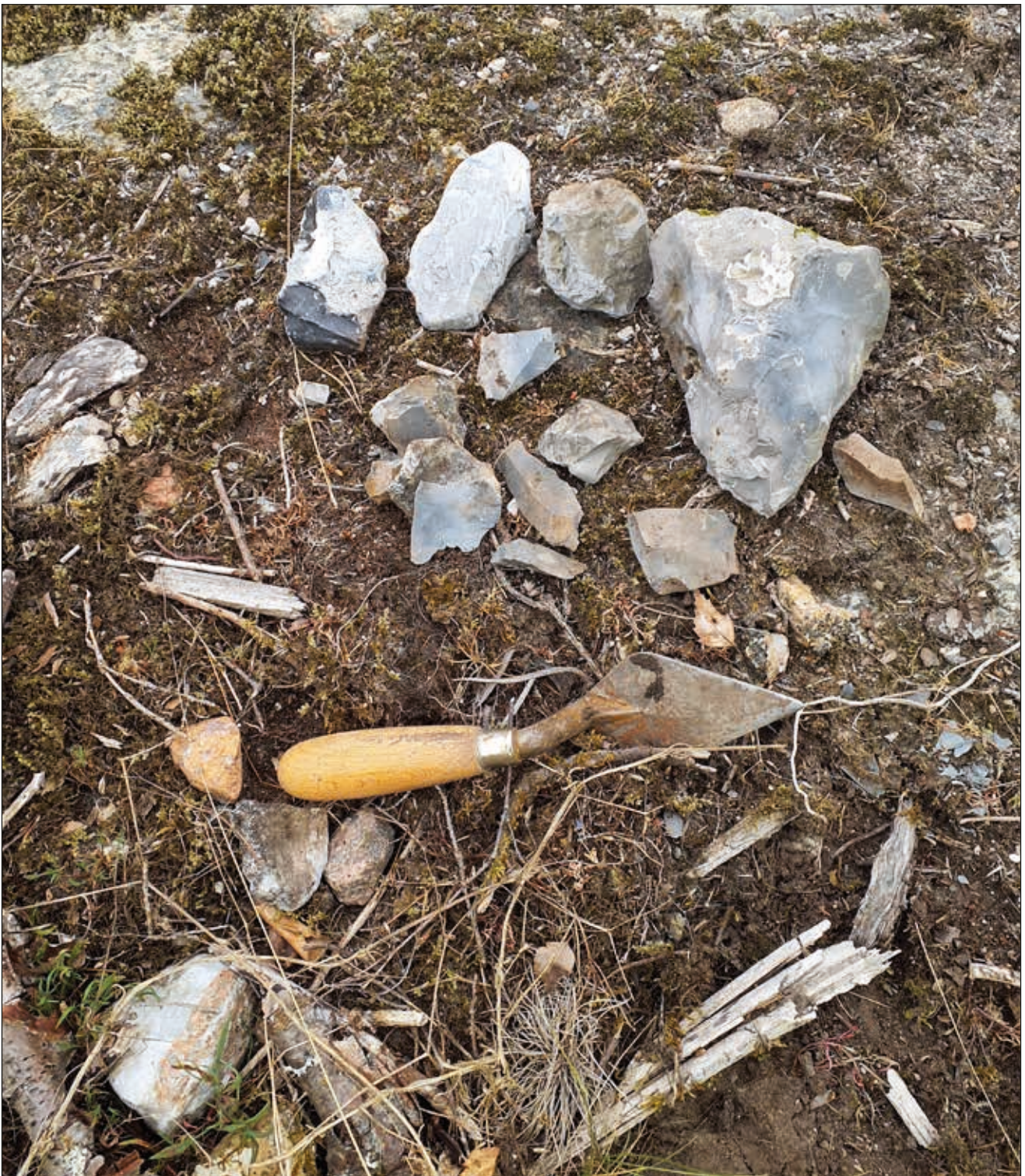
Figur 11. Ihopsamlade flintor som låg på ytan i området med husgrunder.

De flinstycken som låg öppet i den bergiga delen av ytan (figur 11), skulle med god vilja kunna vara rester av den fyndsamling som betecknats L1968:7818. Dessa flintor uppvisade få eller inga, tecken på mänsklig bearbetning. De gick därför inte att verifiera som ovan nämnda registrerade fynd. Inte heller går det att säga något om deras ursprung. Då inga andra fynd som skulle kunna tänkas höra till registreringen hittades måste denna samling av fynd bedömas som förlorad.