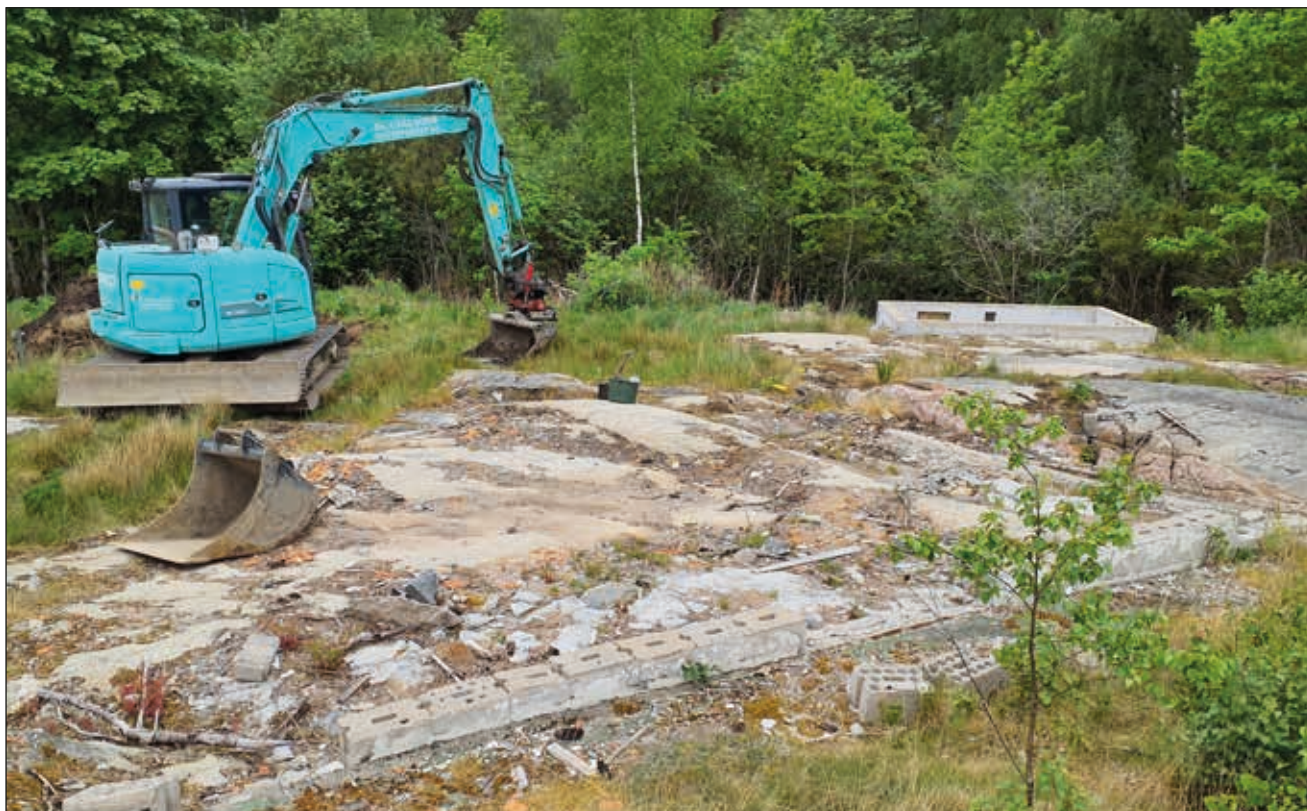
Figur 6. Bergsytan i norra delen av fastigheten med husgrunderna från de nyligen rivna husen. Foto mot nordväst.

Fastigheten Sörslättshögen 2:4 har fram tills nyligen utgjort mark till ett fritidshus som stått på plats fram tills vårvintern 2023 då huset revs (figur 6). I samband med detta har även alla träd på platsen avverkats. Detta har lämnat förvånansvärt lite spår av åverkan på markytan inom området. Tomten består av två distinkta naturmiljöer; en plan yta i öster och ett kuperat bergsområde i väster. Totalt grävdes 13 schakt (figur 7). Generellt var samtliga grävda schakt påverkade av sentida aktiviteter i olika former.