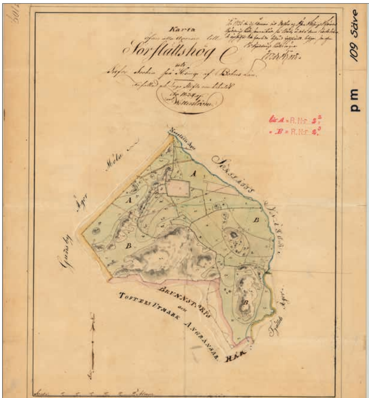
Figur 4. Laga skifteskartan, "Karta öfver alla ägorne till Sörslättshög uti Säfve socken på Hising af Bohus Län" från 1835.

På ekonomiska kartan från 1936 är ännu inte avstyckningen genomförd (Lantmäteriet 2023b). Marken är här markerad som betesmark. Noterbart är att landskapet ter sig som mycket mer öppet och utan större skogsansamlingar. På 1976 års ekonomiska karta är marken nu avstyckad och markerad som Sörslättshögen 2:4 (Lantmäteriet 2023c). Tomten är även bebyggd med ett hus och två skjul.