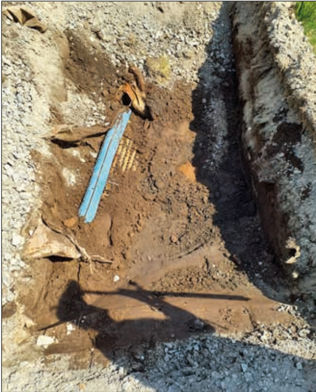
Figur 9. Exempel på graden av störning i vissa schakt. I S8 påträffades exempelvis dränering och kablar 0,65 meter ned i schaktet.