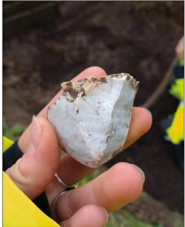
Figur 10. Den vitpatinerade kärnan som hittades i S10.